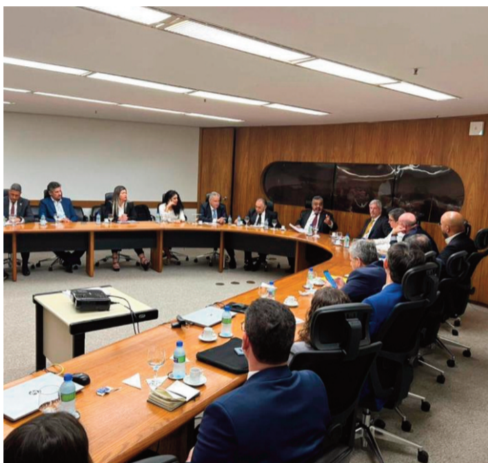
Delegação angolana foi recebida em vários Ministérios brasileiros

- Em relação ao proposto Acordo para Evitar Dupla Tributação, entendemos que a sua inexistência, no plano bilateral, acarreta considerável ônus financeiro às empresas e aos empresários brasileiros sediados em Angola, enfatizou. - Entendemos como prioritária a negociação desse acordo, uma vez que a sua implementação traria diversos benefícios para o comércio e investimentos bilaterais, e contribuiria, sobretudo, para o aumento da competitividade das empresas brasileiras neste país. Quanto à celebração de um