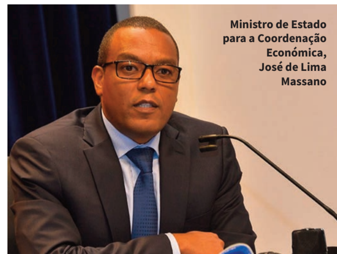
Ministro de Estado para a Coordenação Económica, José de Lima Massano

“Temos consciência de que o Governo brasileiro e o Governo angolano têm órgãos específicos responsáveis para tratarem de questões tributárias internacionais, como a Receita Federal do Brasil e a Administração Geral Tributária de Angola. Mas colocamo-nos à disposição para colaborar no entendimento de que as conversas podem ocorrer inclusive em fóruns bilaterais, por meio de comités de cooperação económica ou por meio da colaboração com entidades governamentais relacionadas”, salientou Cristiano Horta.